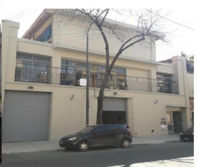
Oficinas Sede - Av de Mayo - Obra Civil : Tareas de Durlock - Pintura – Electricidad.

Área Tecnológica para abastecer los Puestos de trabajos y los predios en su integridad : Armado de cable estructurado, tendido de fibra óptica, telefonía y HDMI. Circuitos eléctricos y de redes CAT6, Instalación de cámaras para vigilancia - Redes - Sistemas - Data center - UPS WI-FI - Instalación de Tv leds. Provisión integral de mobiliario.